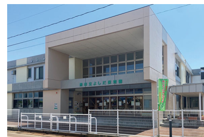
燕市吉田統合保育園新築工事 （機械設備）