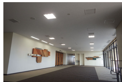
燕市吉田産業会館大規模改修工事 （機械設備）