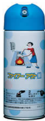
①ファイアーアウト