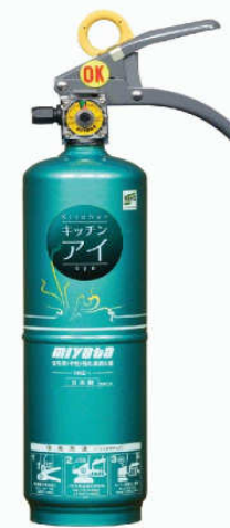
⑤キッチンアイ (選べる4色)